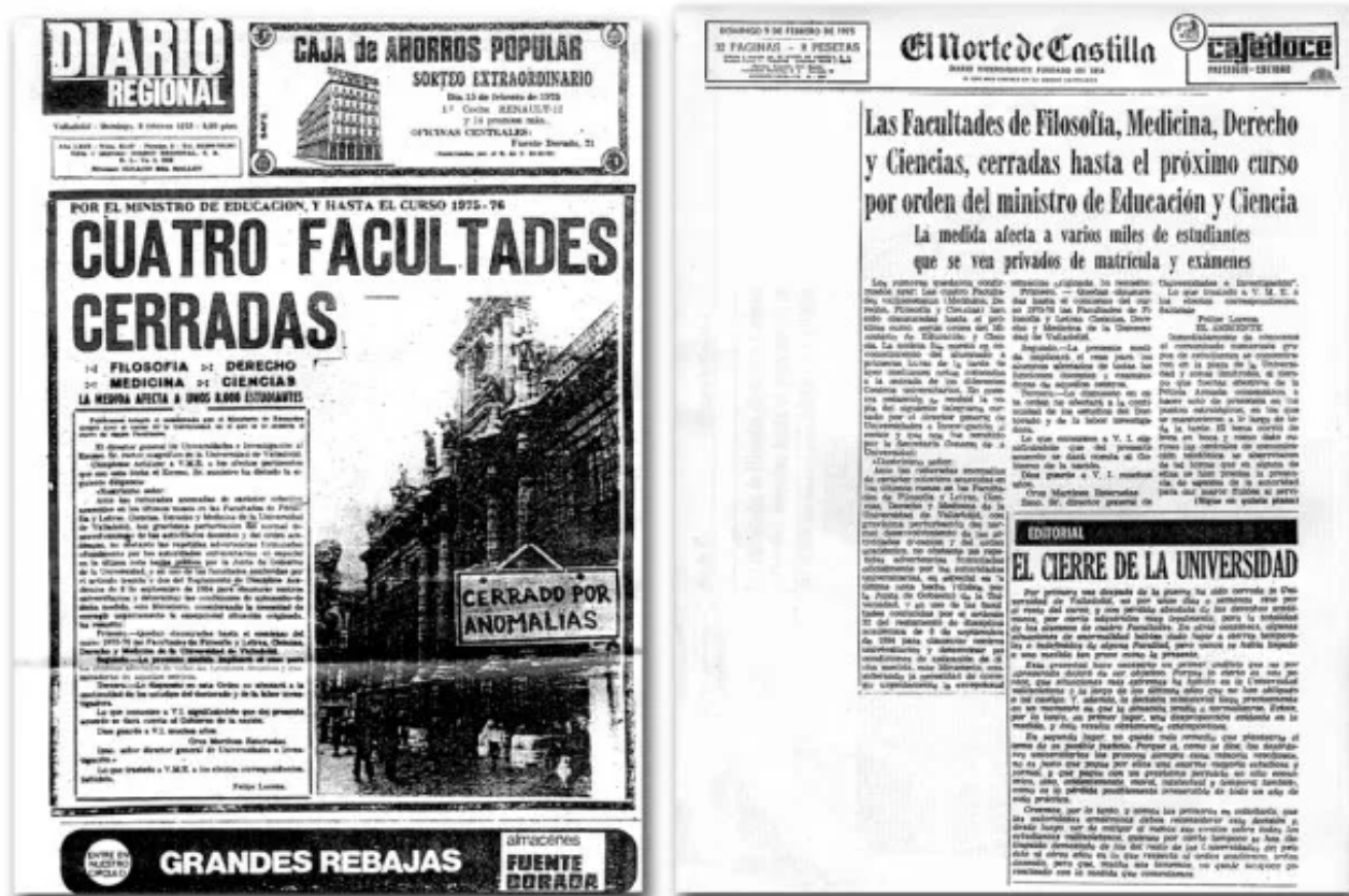
PRIMERAS PÁGINAS DEL DIARIO REGIONAL Y EL NORTE DE CASTILLA, EL 9 DE ENERO DE 1975, CON LA NOTICIA DEL CIERRE DE LA UNIVERSIDAD DE VALLADOLID. EN EL ARTEFACTO '30 AÑOS DESPUÉS. LA CANCIÓN POÉTICA. ENTRE LA SUBVERSIÓN Y LA SUBVENCIÓN', EDITADO EN SEPTIEMBRE DE 2004.