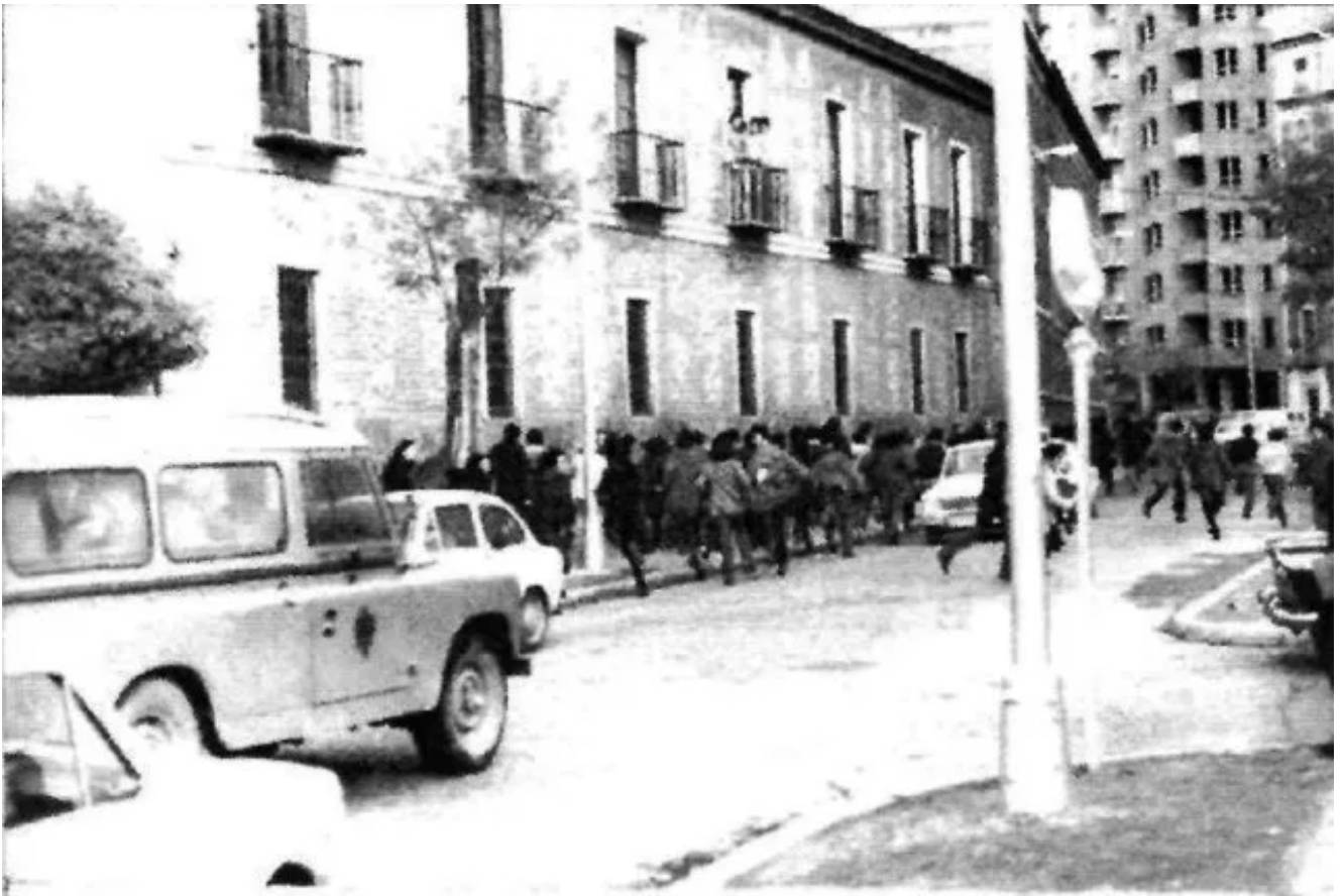
CARGAS POLICIALES EN LOS ALREDEDORES DEL PALACIO DE SANTA CRUZ.